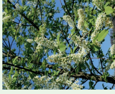
Traubenkirsche Prunus padus