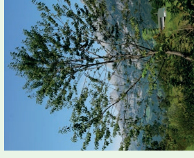
Vogelkirsche Prunus avium