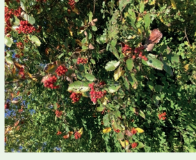
Echter Mehlbeerbaum Sorbus aria