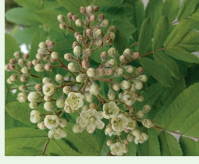
Speierling Sorbus domestica