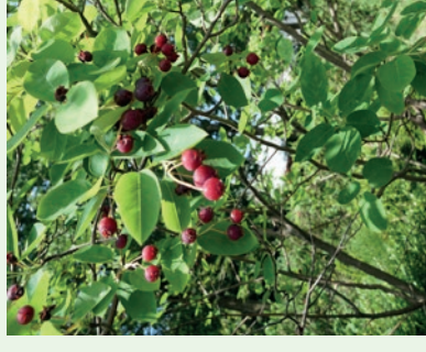
Felsenbime Amelanchier ovalis