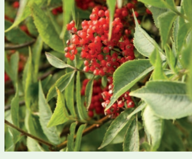
Roter Holunder Sambucus racemosa