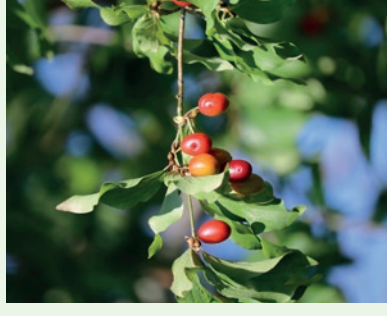
Tierlibaum Cornus mas