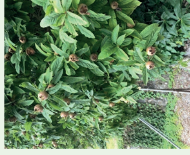
Echte Mispel Mespilus germanica