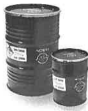
UN-geprüfte Stahlfässer 50 und 212 Liter für Lithium-Ionen-Akkus

Die gefüllten Behälter werden auf Ihre Anweisung ausgetauscht. Die Dienstleistung ist für Sie kostenlos. Es gilt zu beachten, dass alle gebrauchten Batterien als Sondermüll gelten, Lithium-Batterien und Lithium-Akkus zusätzlich als Gefahrgut. Gemäss Verordnung über den Verkehr mit Abfällen VeVA, Art. 6, müssen die für den Transport nötigen Begleitpapiere durch den Abgeber (Sammelstelle) ausgestellt werden. Wird diese Aufgabe von den Transporteuren übernommen, können diese dafür einen kleinen Beitrag verlangen.