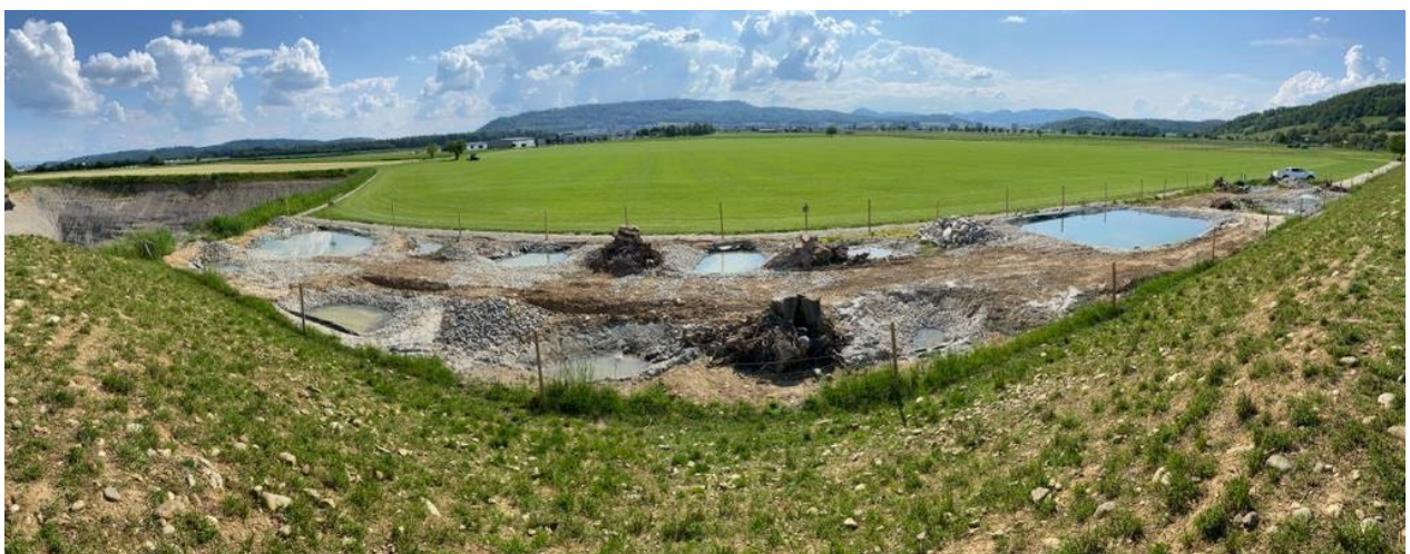
Bildlegende: Tümpellandschaft im Gebiet Lindenacher Ost in Mülligen

Im Bereich Biodiversität besteht Grund zur Freude: Letzten Frühling hat Holcim, als Teil der ökologischen Ersatzmassnahmen für den Kiesabbau, eine Tümpellandschaft von rund 1400 Quadratmetern geschaffen. Das Hauptziel war die Schaffung von Laichgewässern für Kreuzkröten. Bereits eine Woche nach Abschluss der Arbeiten wurde die europaweit geschützte Kreuzkröte gesichtet. Kurz darauf konnte erster Laich festgestellt werden, was für Holcim und den ökologischen Ausgleich einen grossen Erfolg darstellt.